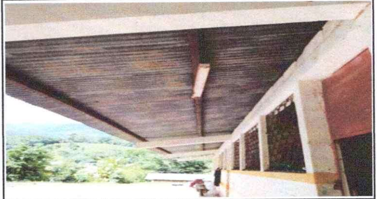
Foto 2: Se observa que las conexiones electricas requiere un cambio total cambio ya que hace un tiempo hubo un corto circuito y quemó toda la conexión eléctrica.