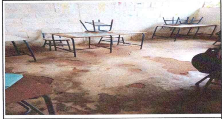
Foto 4: Se observa que la torta del piso ya está deteriorada que solo se levanta cuando barren los niños y se ve la tierra, se estanca el agua cuando llueve y filtra la lluvia.