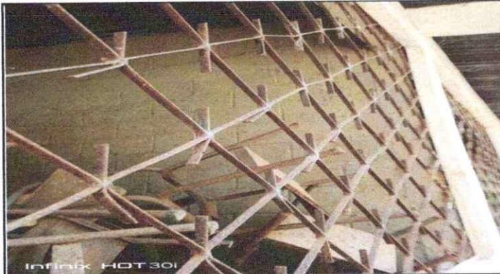
Foto 3: Reparación y mantenimiento de balcones ya que están bien oxidadas