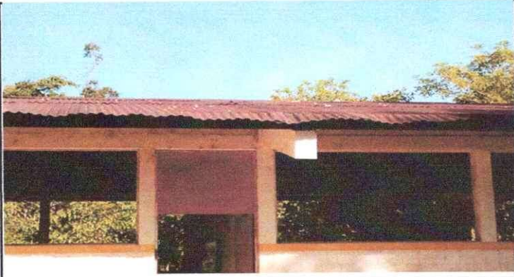
Foto1: Se observa que se necesita el cambio total del techo de las aulas ya que cuando llueve filtra agua y los niños son los mas afectados.